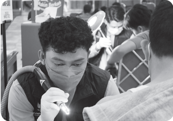
HAPUS TATO GRATIS

Petugas menghapus tato pada lengan seorang warga saat program hapus tato gratis di Kantor Wali Kota Jakarta Timur, Selasa (4/4). Baznas (Bazis) wilayah Jakarta Timur bersama Islamic Medical Service menggelar layanan hapus tato gratis bagi masyarakat dengan jumlah peserta 123 orang.